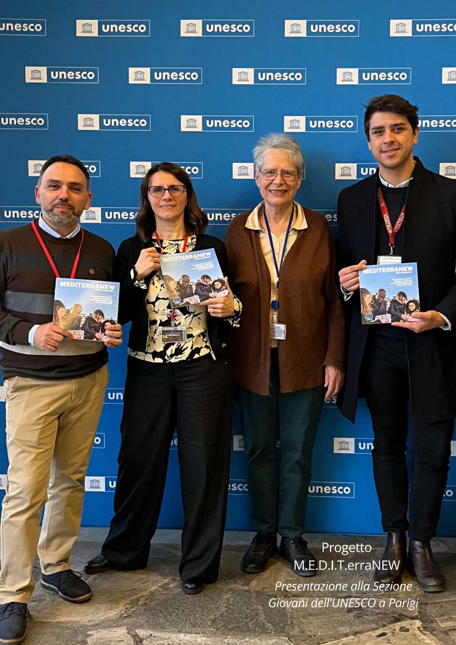
Progetto M.E.D.I.T.erraNEW Presentazione alla Sezione Giovani dell'UNESCO a Parigi