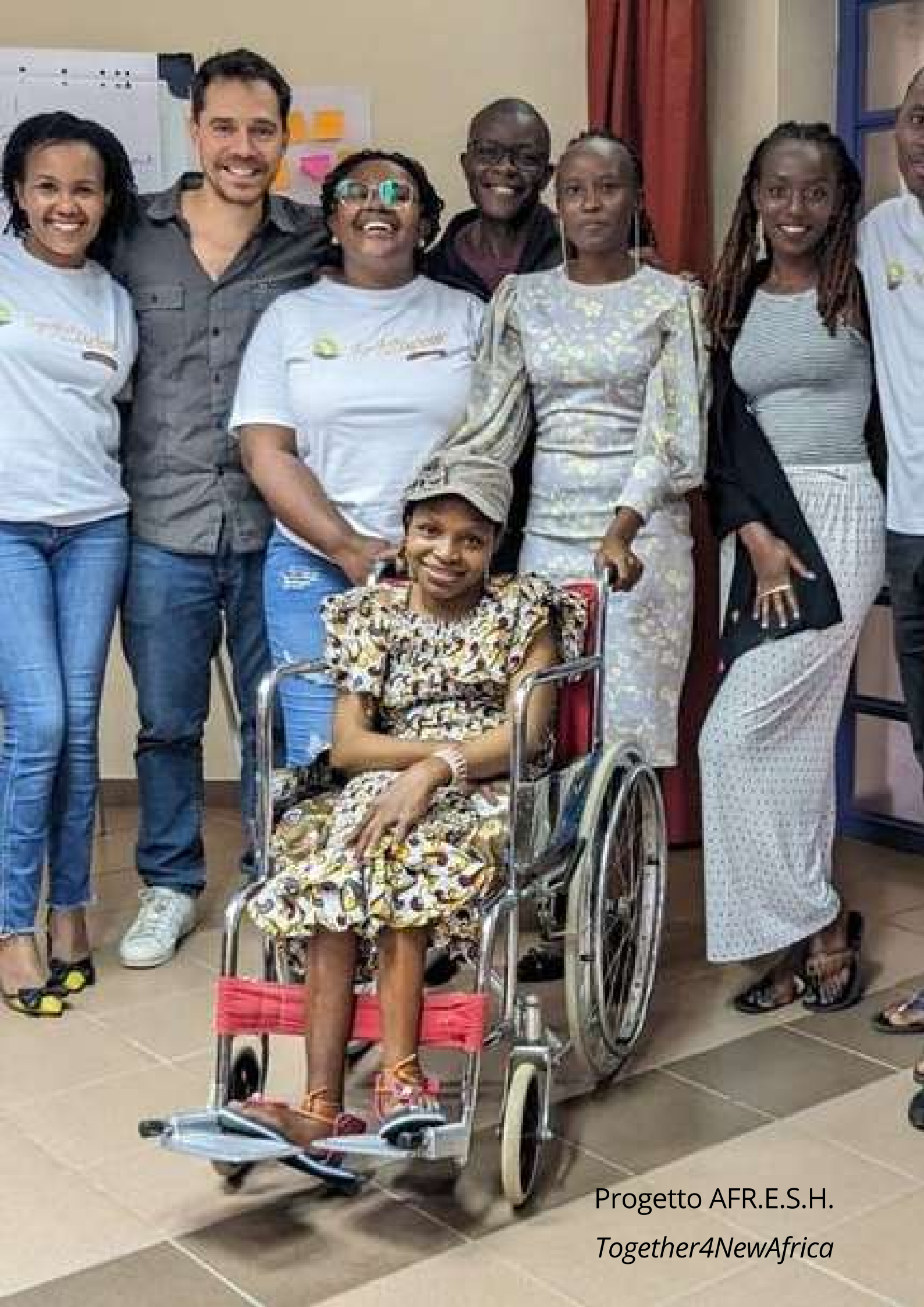
Progetto AFR.E.S.H. Together4NewAfrica